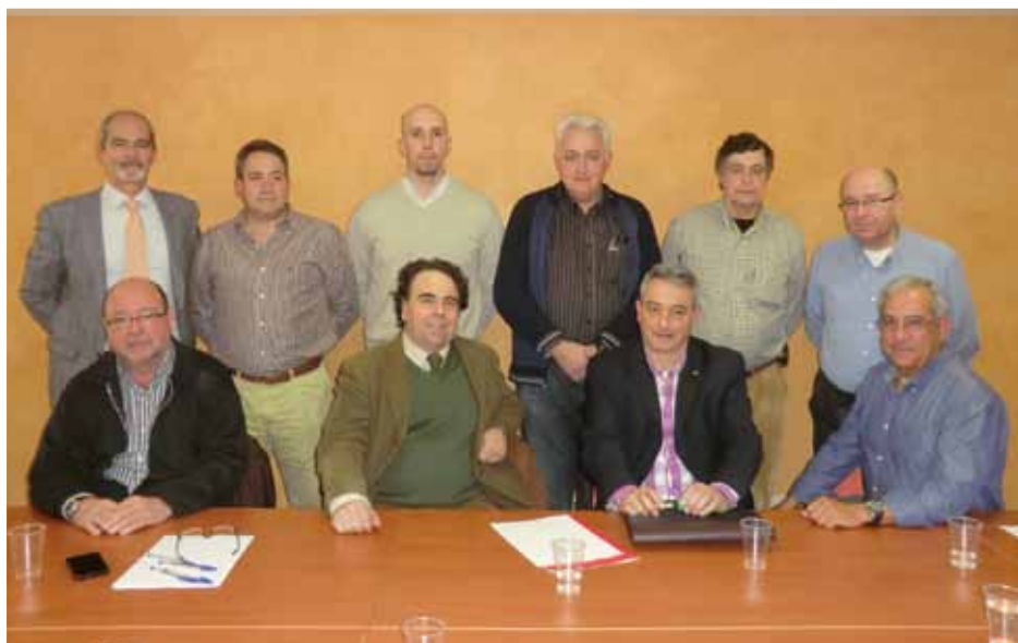
Representantes de APROMAR, UGT y CCOO tras la firma del III Convenio de la Acuicultura marina 2012-2014

El año termina con una triste noticia: la desaparición de la Fundación Observatorio Español de la Acuicultura (FOESA) dentro del marco de reforma de las Administraciones Públicas. Desde aquí queremos reconocer el trabajo realizado desde la Fundación a favor de nuestra acuicultura. ■