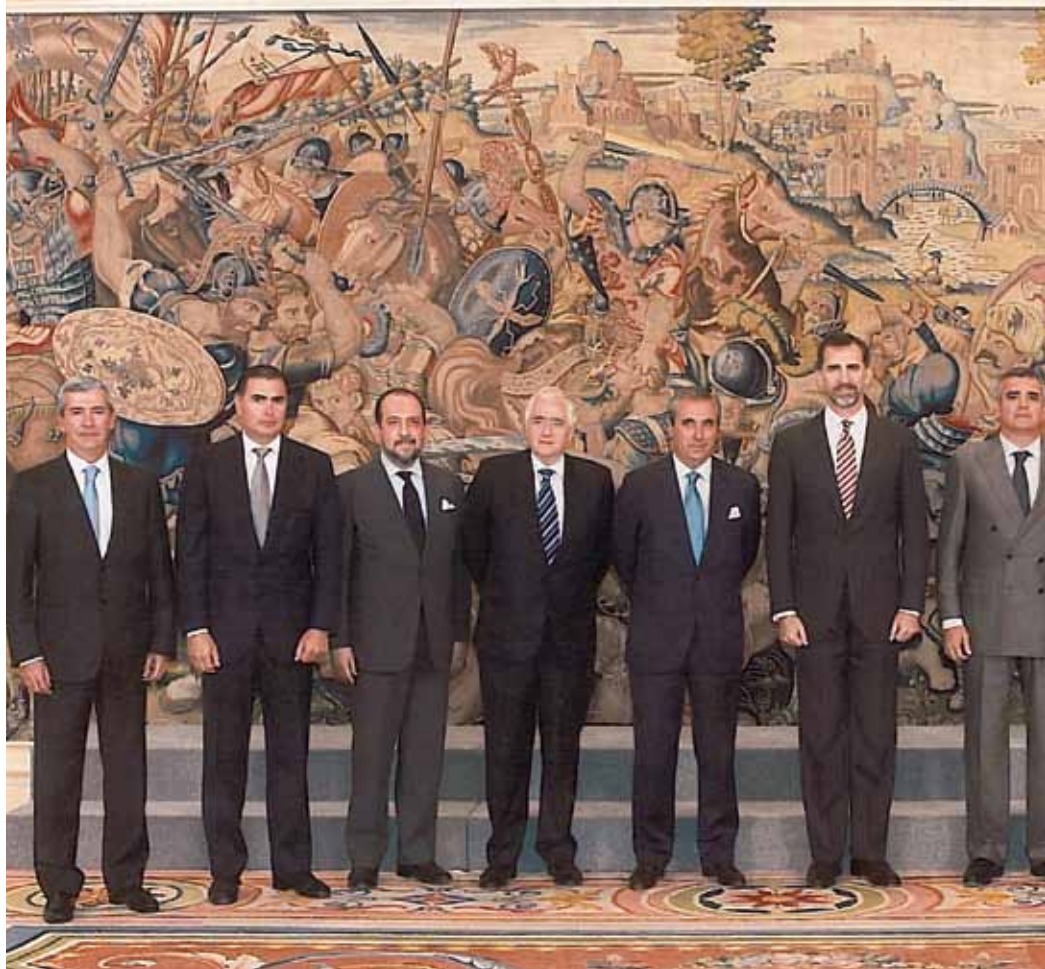
El Príncipe de Asturias recibió a una representación de ECSA y ANAVE en la Zarzuela