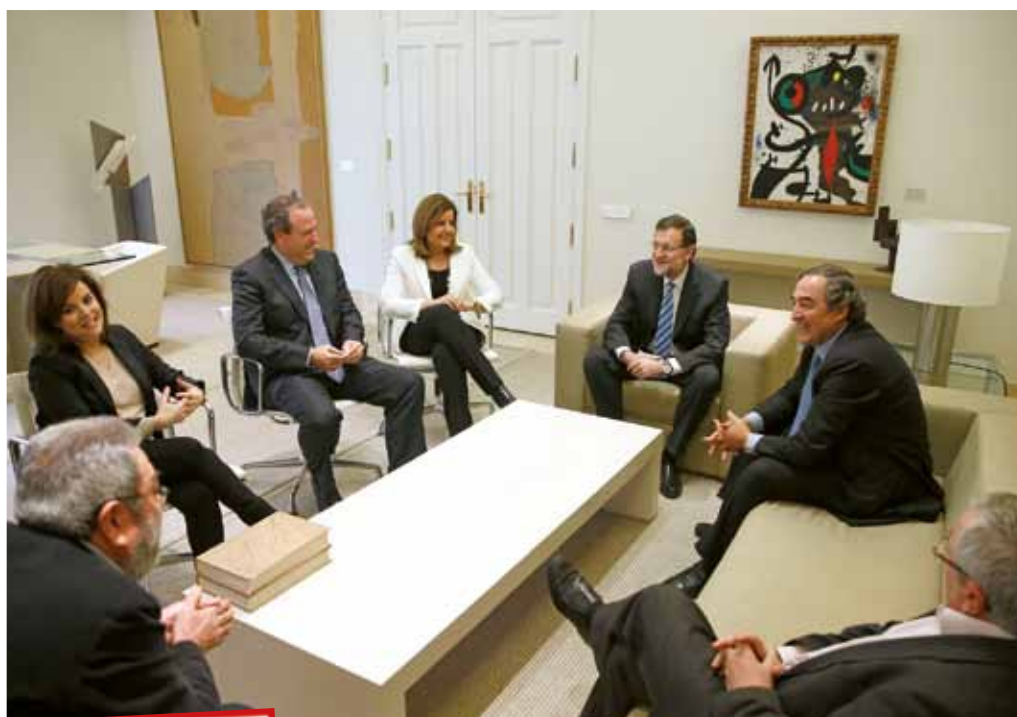
Reunión del presidente del gobierno, vicepresidenta y ministra de Empleo y Seguridad Social con los máximos responsables de UGT, CC.OO, CEOE y CEPYME.