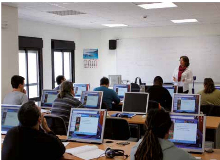
Alumnos en el CNPM de Isla Cristina