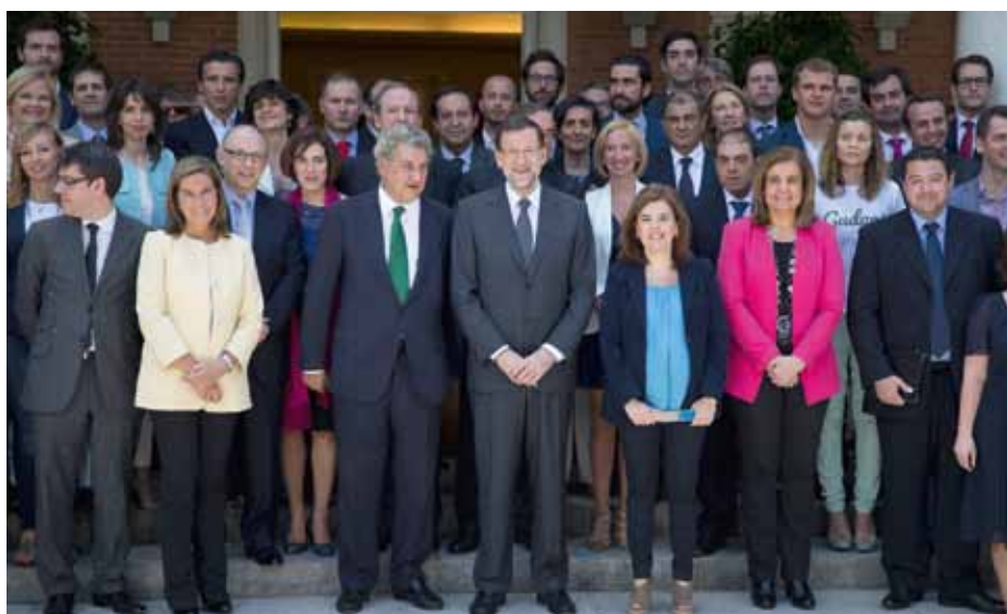
El presidente del gobierno convocó en La Moncloa a un centenar de empresarios y representantes de asociaciones y organizaciones empresariales.