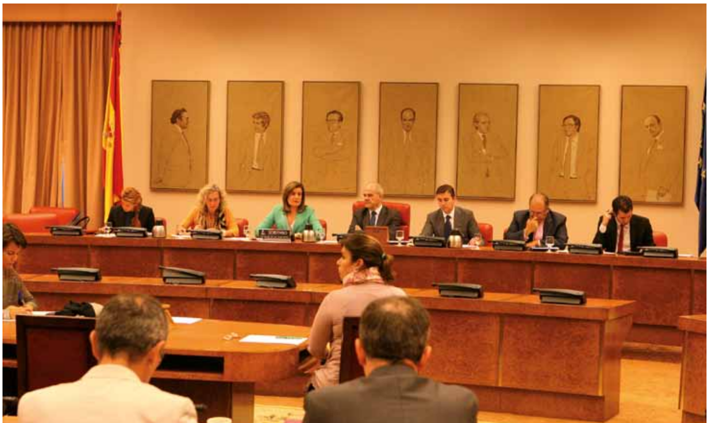
Fátima Báñez interviene en la Comisión de Empleo y Seguridad Social del Congreso para explicar la reforma de las pensiones.

También el Senado aprobó que la Autoridad Fiscal Independiente, órgano que se encarga de elaborar informes sobre las cuentas del Estado, dará el visto bueno a los valores a partir de los cuales se llevarán a cabo los cálculos para establecer las revalorizaciones anuales de las pensiones. Además el Gobierno elaborará cada cinco años un informe para estudiar el impacto de la reforma.