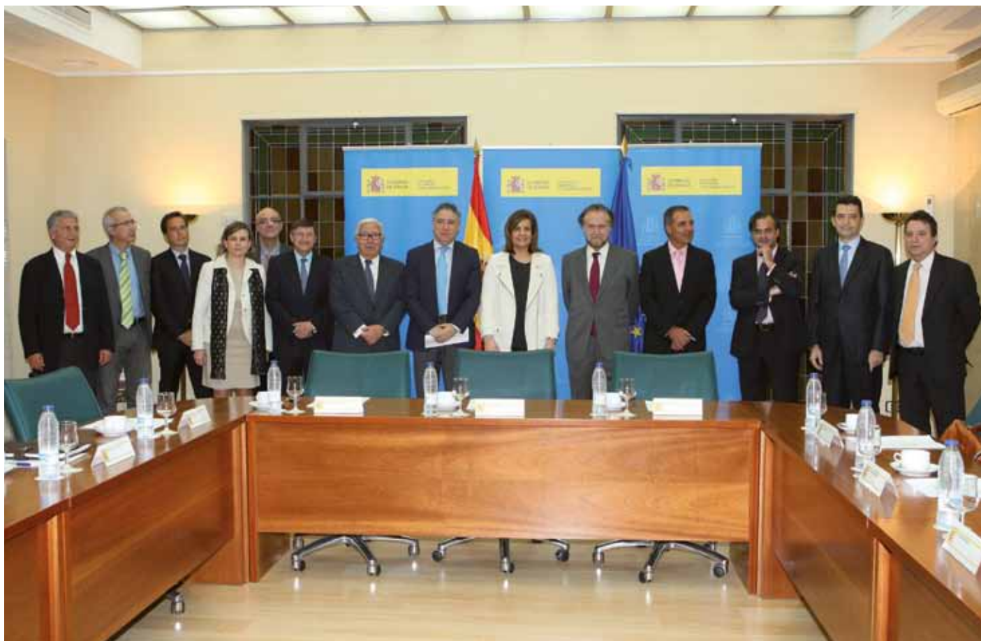
Fátima Báñez y Tomás Burgos con el grupo de expertos encargados de elaborar un estudio sobre la situación actual de las pensiones y su proyección de cara al futuro.

Gobierno revalorizó un 2% las pensiones de 1.000 euros mensuales (3 de cada 4), y el 1% el resto. La variación anual del IPC de noviembre se situó en el 0,2%, lo que constata la ganancia del poder adquisitivo de las pensiones durante este año.