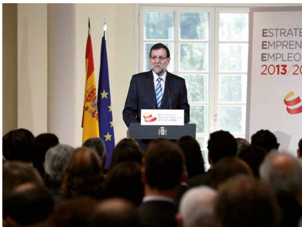
Mariano Rajoy, presidente del Gobierno.

En cuanto al resto de medidas que se implementarán a lo largo de los cuatro años de desarrollo, se ha previsto una