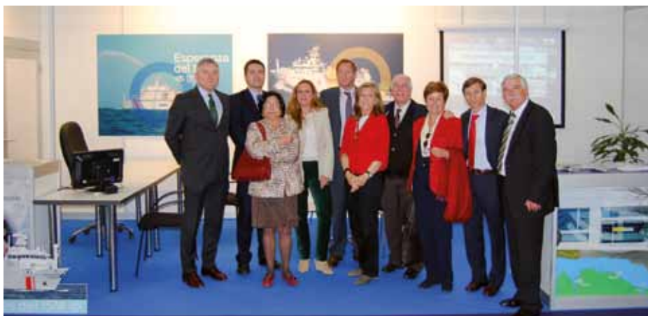
Representantes del ISM en el stand del organismo en Expomar

Las ferias del Mar sirven a las empresas y a la Administración para dar a conocer al público y al sector sus productos y servicios. El Instituto Social de la Marina ha querido, a lo largo del año, apoyar algunos de estos certámenes con su presencia, bien colocando un stand o bien participando en las conferencias y mesas redondas paralelos a estos certámenes.