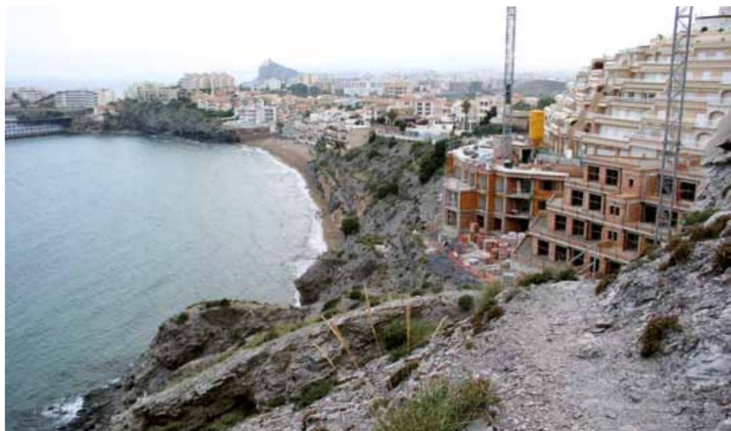
Bahía de Hornillos, Águilas, Murcia.

Cabe destacar, asimismo, entre las principales modificaciones que introduce esta Ley el que las salinas dejarán de estar consideradas como Dominio Público Marítimo Terrestre (DPMT). Esta modificación fue considerada por la Sociedad Española de Ornitología (SEO)