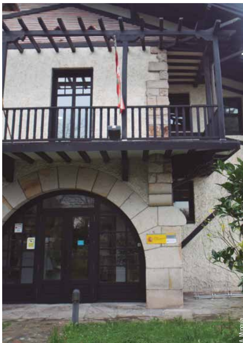
La Dirección Provincial se ubica en un edificio típico del barrio bilbaíno de Begoña

La mar y las actividades en torno a ella han ocupado históricamente un lugar