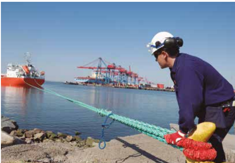
Amarrador en plena tarea

El de la estiba es uno de los campos donde más visible resulta la condición esencial de la actividad.