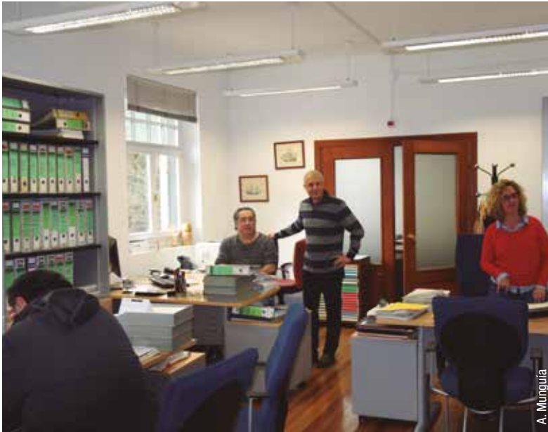
Trabajadores de la plantilla del ISM en Bilbao, formada por 42 personas

sez de vocaciones y la falta de relevo generacional es uno de sus grandes retos, después de ver como los jóvenes rehúyen el embarque. En Bizkaia, cerca de un tercio de los trabajadores en alta tienen entre 40 y 49 años (1.032) y 813 están entre los 50 y 59 años, es decir que, entorno a 2.000, de los más de 3.300 trabajadores en alta, tiene más de 40 años.