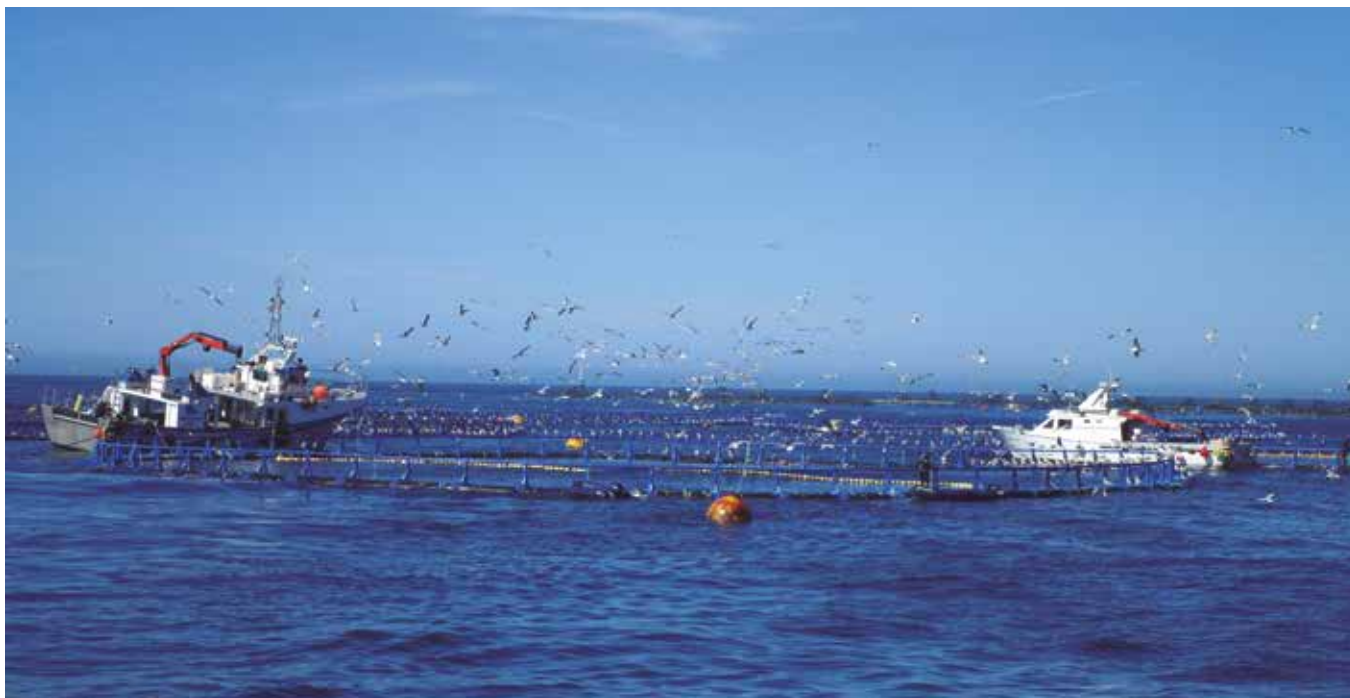
La acuicultura se enfrenta a una crisis profunda

La acuicultura es uno de los sectores para los que el 2020 ha comenzado como "annus horribilis". A las importantes pérdidas que ocasionó el temporal "Gloria" en algunas instalaciones del Mediterráneo, se une ahora la crisis sanitaria y socioeconómica provocada por el coronavirus que lleva al sector a una profunda depresión. La Asociación Empresarial de Acuicultura de España (APROMAR), nada más comenzar la pandemia, se dirigió al Ministerio de Agricultura, Pesca y Alimentación solicitando ayudas que hoy, más que nunca, se hacen imprescindibles.