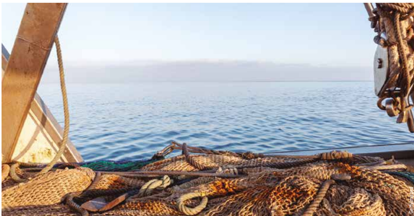
Los autónomos cobrarán al menos 661 euros

La pandemia va remitiendo y comenzamos con lo que se ha venido a llamar la “desescalada”. Tras las primeras decisiones y con el objetivo de dar respuesta a las necesidades detectadas, se han seguido habilitando medidas de protección del tejido productivo y social del país. En concreto, los autónomos y las pequeñas y medianas empresas (pymes) son colectivos sobre los que se está poniendo especial énfasis al considerarse especialmente vulnerables ante el parón de la actividad económica generado por la crisis sanitaria del coronavirus.