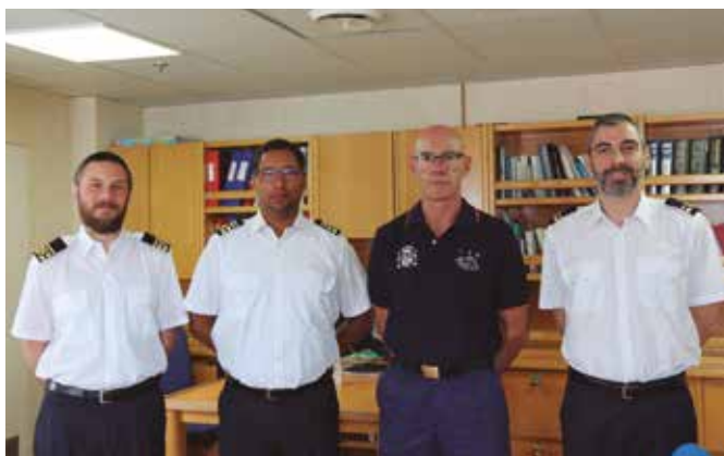
Equipo médico del buque Esperanza del Mar

Antes de llegar a destino, el 8 de abril tuvo que desviarse de su rumbo para rescatar a un marinero del palangrero Ribel Tercero con síntomas de coronavirus cuando se encontra-