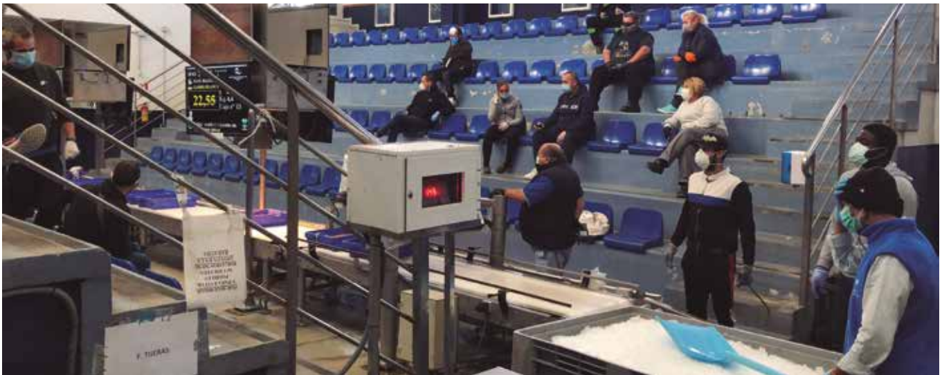
Lonja de Pescados de Almería en tiempos de COVID-19

luña, Comunidad Valenciana y Baleares, mientras que en Andalucía, por algún desfase en la interpretación, está previsto que comiencen a resolverse en estos días.