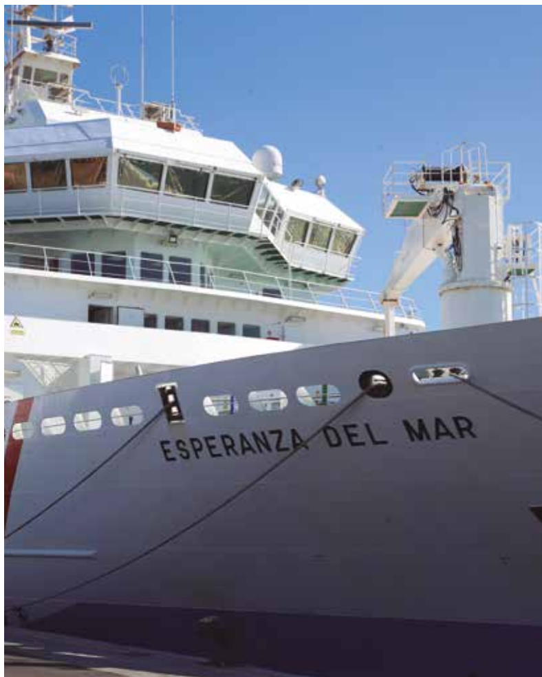
Buque Hospital Esperanza del Mar

Las llamadas al CRM se han multiplicado desde el decreto, la mayoría piden protocolos de actuación ya que el Centro funciona las 24 horas