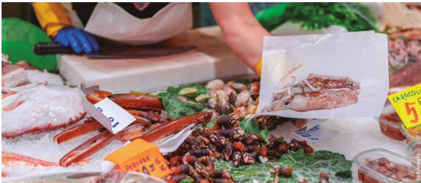
Autónomos y empresas pueden solicitar aplazamiento de pagos a la Seguridad Social

para "alinear las bases impositivas de los impuestos a la situación real a la que se enfrentan las empresas, sobre todo pymes y autónomos". Así, los trabajadores autónomos podrán realizar el cálculo de los pagos fraccionados del IRPF y el ingreso a cuenta del régimen simplificado del IVA con el método de estimación objetiva, lo que ajustará el pago a los ingresos reales. Por su parte, las empresas podrán igualmente adaptar las liquidaciones de los ingresos a cuenta a la previsión de ingresos estimada para 2020, a la vez que se establece la posibilidad de supeditar el pago de las deudas tributarias del impuesto de sociedades a la obtención de la financiación a través de la línea de avales del Instituto de Crédito Oficial (ICO).