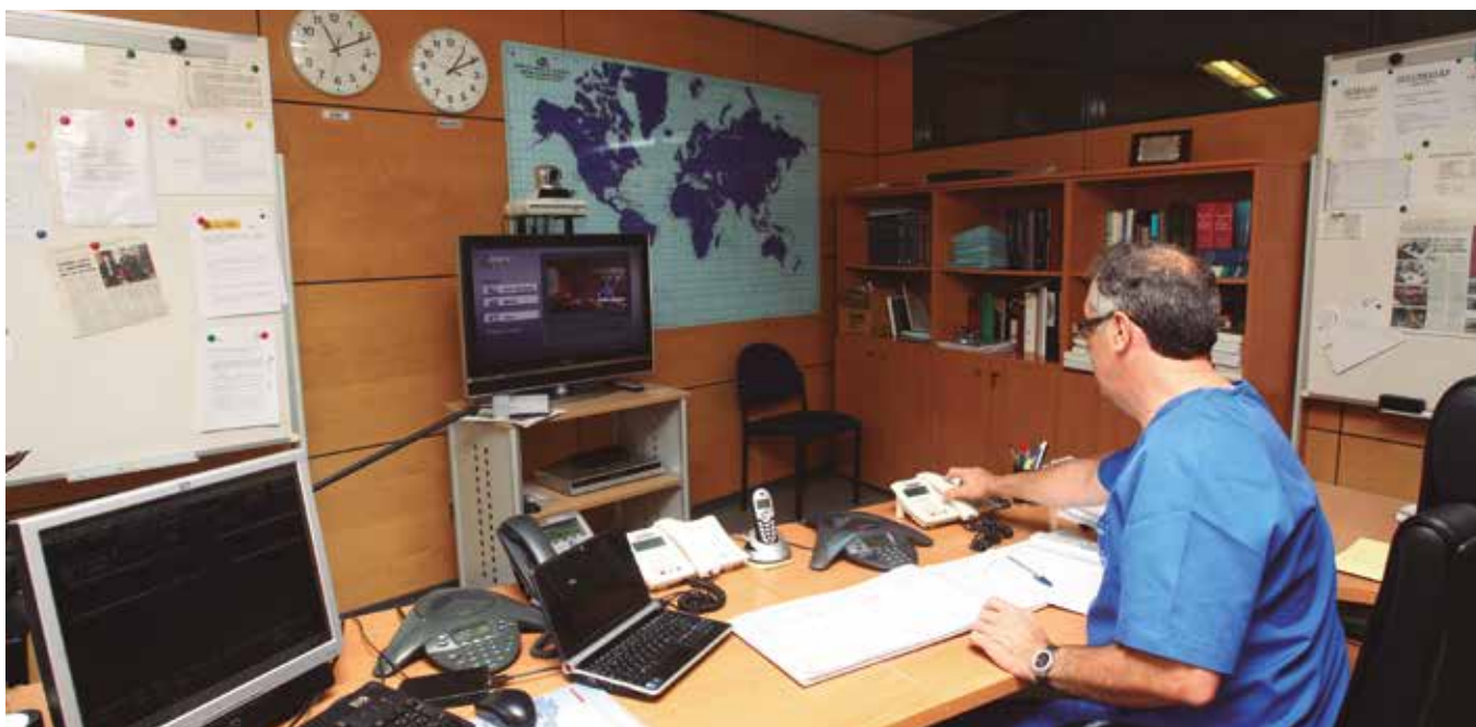
Centro Radio Médico en Madrid

Incluso antes de que el 14 de marzo se decretase el estado de alarma por la pandemia de COVID el servicio de Sanidad Marítima del Instituto Social de la Marina se puso manos a la obra con todos los medios disponibles al servicio del sector: El Centro Radio Médico, los dos buques hospitales y los Centros Asistenciales en el Extranjero.