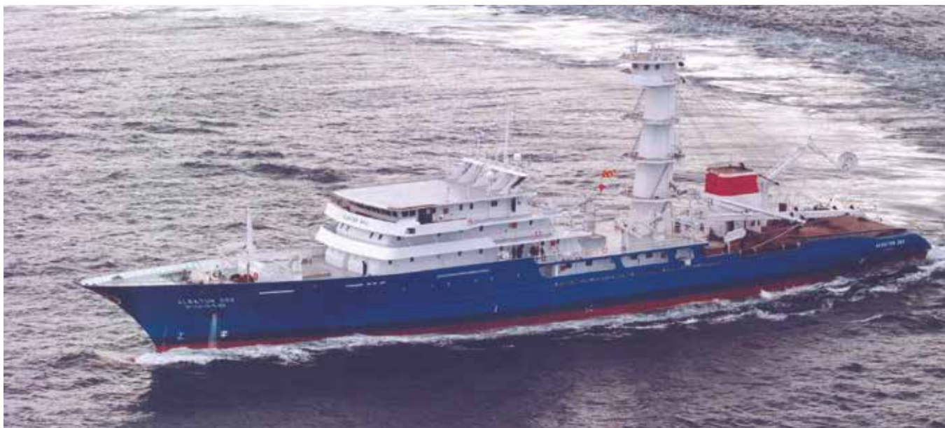
En la imagen, uno de los buques de gran altura registrados en Bermeo