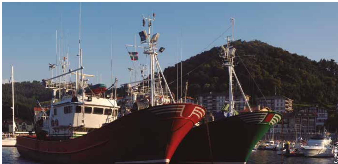
Pesqueros en el puerto de Ondarroa

Por otra parte, y como viene sucediendo en los últimos años en el sector marítimo pesquero en general, la esca-