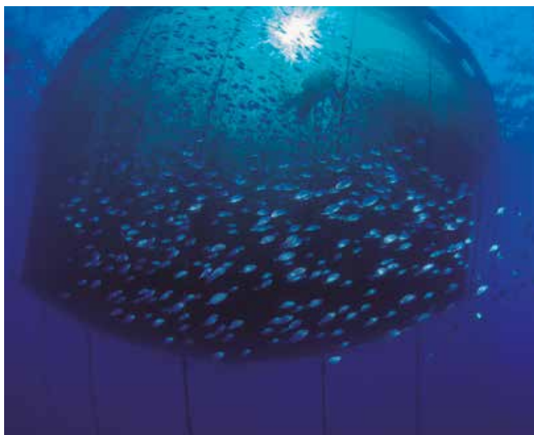
Se va a producir un inesperado aumento de biomasa en las jaulas