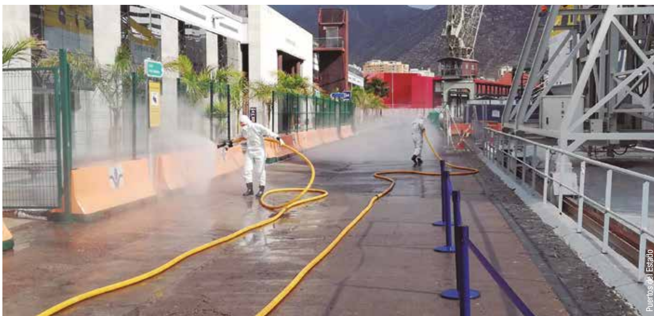
Efectivos de la UME higienizando instalaciones portuarias

El sistema portuario es uno de los termómetros de la influencia sobre la economía de cualquier episodio relevante, positivo o negativo. En la actual situación también, aunque con la particularidad de que el foco puesto en la logística, como eje esencial para asegurar el abastecimiento de la población, ha hecho que el impacto, aun siendo evidente, haya resultado algo menor en algunos capítulos.