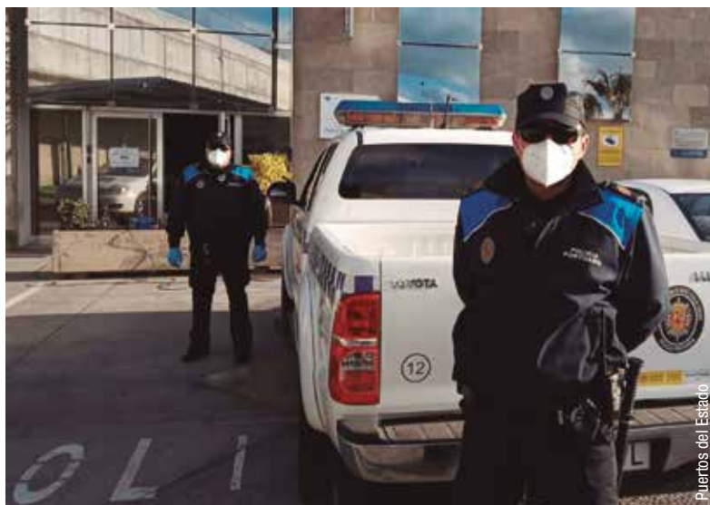
Entrega de mascarillas en el puerto de Tenerife