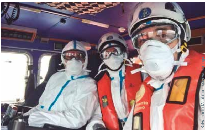
Bien pertrechados para el desarrollo del trabajo

En el momento de cerrar estas líneas, de los 640 amarradores asociados a AEEA todos estaban operativos, “salvo tres casos de contagiados que fueron aislados con sus correspondientes compa-