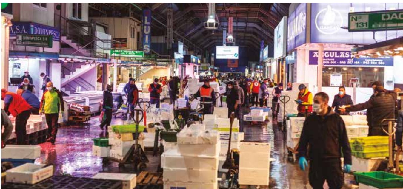
Lonja del pescado de MercaMadrid (AEMPM)

La pandemia del coronavirus, y el confinamiento, ha puesto del revés a todo el planeta, en apenas pocos días hemos vivido un cambio de costumbres que ha trastocado absolutamente nuestras vidas y modificado nuestros hábitos, queramos o no, pero si hay algo que el Covid19 no puede infectar es el instinto de supervivencia del ser humano y para ello su mejor herramienta es la creatividad.