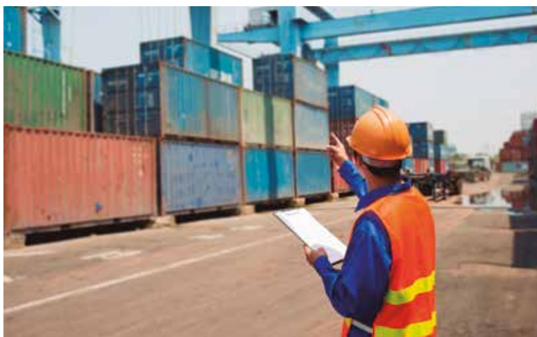
Mantener la cadena de suministro se ha considerado esencial

En los centros de coordinación de Salvamento se han dado instrucciones para que cada turno lo realicen siempre las mismas personas y se reduzca el personal. La flota marí-