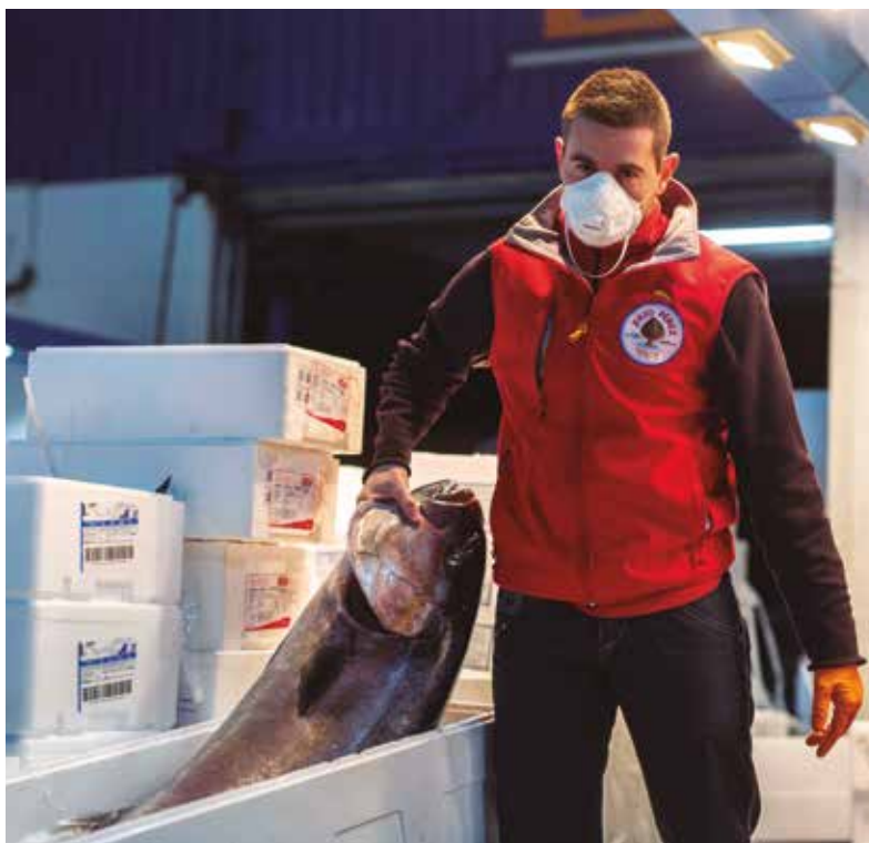
Pescadero con EPI (AEMPM)

En Málaga surgió El Mercado del Pescado, una web de venta online de pescado y marisco fresco de la provincia que ha conseguido quintuplicar sus ventas, incluso hay días que se quedan sin género y tienen que pedirlo a otros minoristas. El consumidor especifica el precio máximo que quiere pagar por el producto y si lo quiere limpio o incluso cocido. La