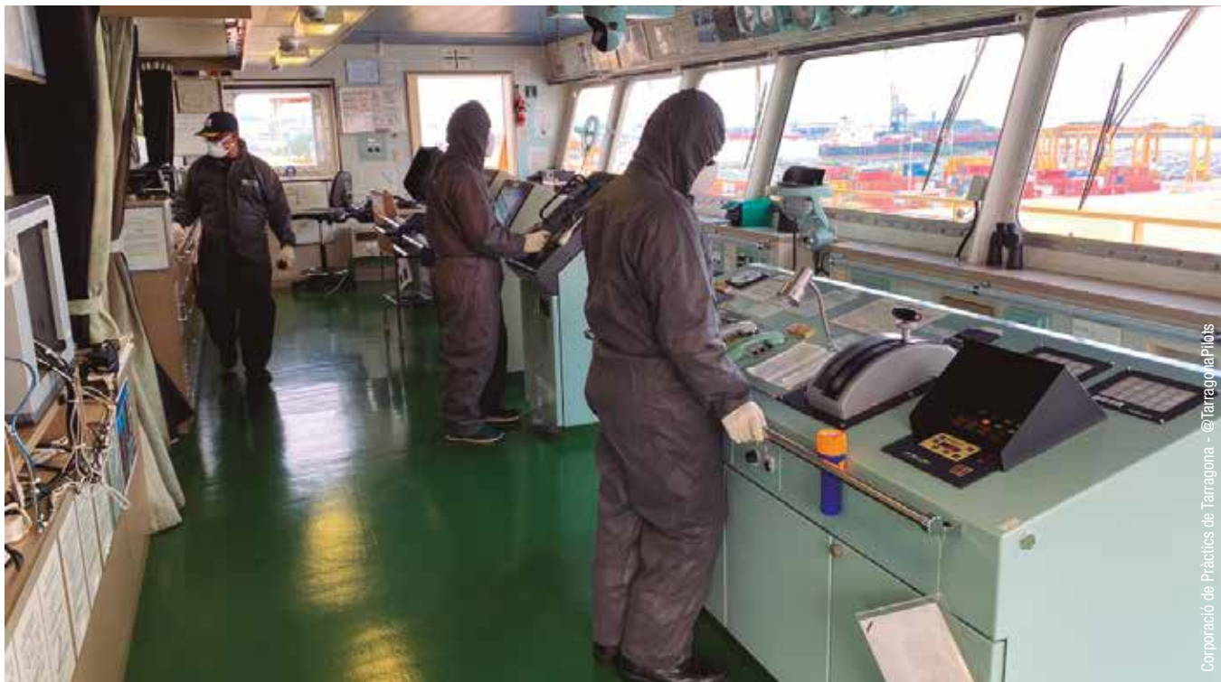
Corporació de Pràctics de Tarragona - @TarragonaPilots

No hay precedentes de que una norma legal deje tan a las claras qué actividades y profesionales son imprescindibles para mantener el ciclo vital de una sociedad. Con la primera prórroga del estado de alarma vino la orden que identificaba las áreas esenciales, donde quedaron encuadrados la mayoría de trabajadores del mar. Repasamos cómo lo han vivido algunos de estos colectivos.