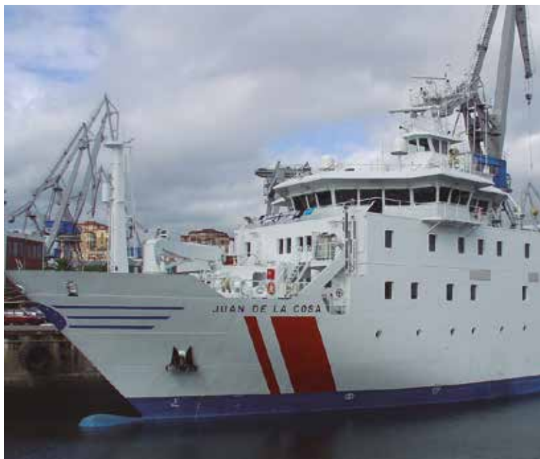
Buque hospital Juan de la Cosa

El buque llevaba más de quince días en la mar cuando se decretó el estado de alarma, lo que garantizó que nadie de la tripulación estaba con-