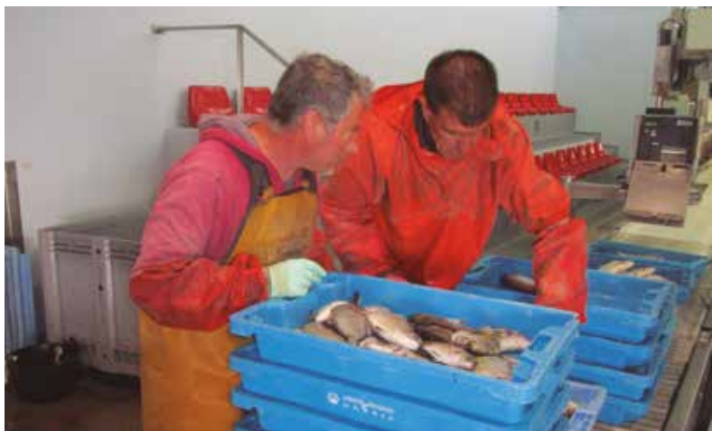
La acuicultura se enfrenta a una crisis profunda

En homenaje a todos los trabajadores que forman parte de la cadena alimentaria, desde productores a la distribución comercial, el Ministerio de Agricultura, Pesca y Alimentación ha puesto en marcha en sus redes sociales la campaña #AlimentaisNuestraVida. La iniciativa cuenta con el apoyo de periodistas y artistas que reconocen el trabajo de las personas que, en estos momentos de crisis por el coronavirus, hacen posible que no falten alimentos en nuestras mesas.