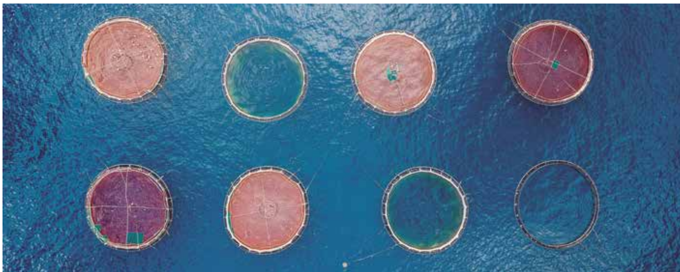
La acuicultura también se beneficiará de las ayudas comunitarias

dando estabilidad al mercado y reduciendo el riesgo de que los productos sean desperdiciados, pero recuerdan que la clave está en cómo se llevarán a la práctica. Los agentes sociales esperan, en este sentido, flexibilidad por parte de los Estados de la Unión.