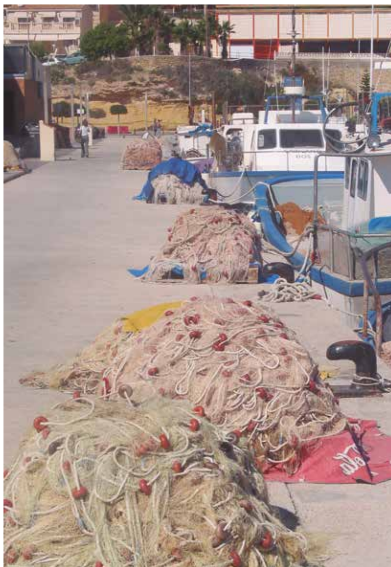
Algunos barcos pequeños han podido acogerse a ERTE por fuerza mayor

Día a día, se ha ido retomando también la actividad en los puertos del Mediterráneo y del Gófo de Cádiz, después de algunas semanas en las que cerca del 50% de los barcos tuvo que dejar de salir a faenar. Para