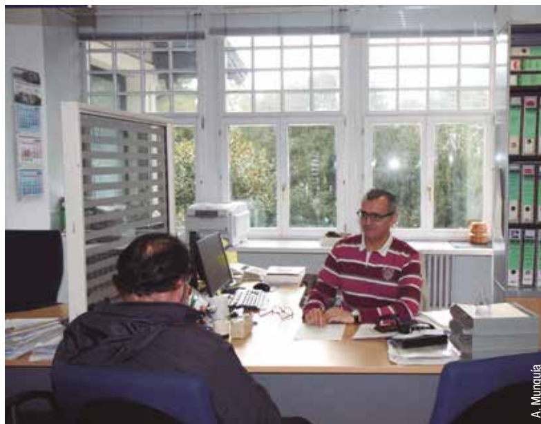
La atención del Instituto siempre ha sido muy personal y directa

La excepcional situación generada tras la llegada del COVID 19 afecta sin duda a una institución como el ISM, siempre tan cerca de sus afiliados. Como comenta el director, al suspenderse la atención presencial, que ha sido siempre el santo y seña de nuestra presencia en el sector y a pesar de las dificultades que pudieran