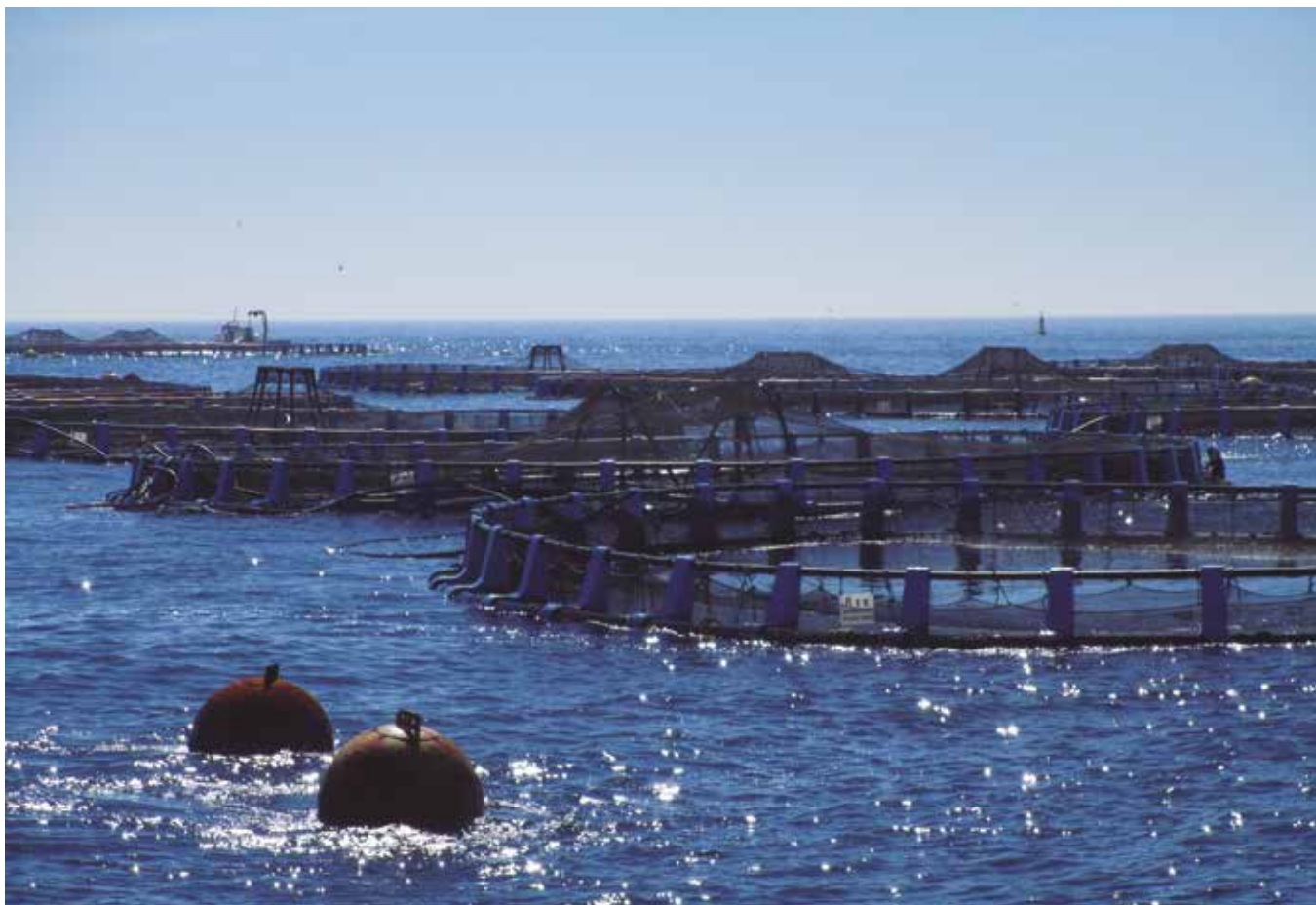
La acuicultura reclama ayudas con urgencia