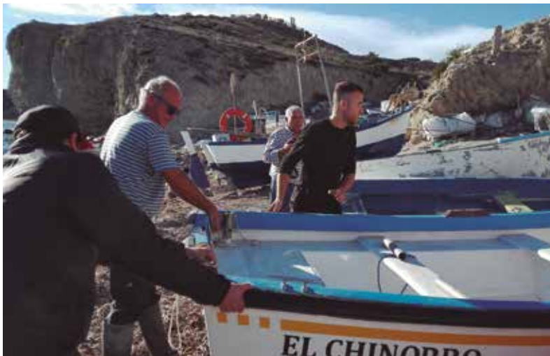
El sector se ha visto dañado seriamente por los efectos del coronavirus