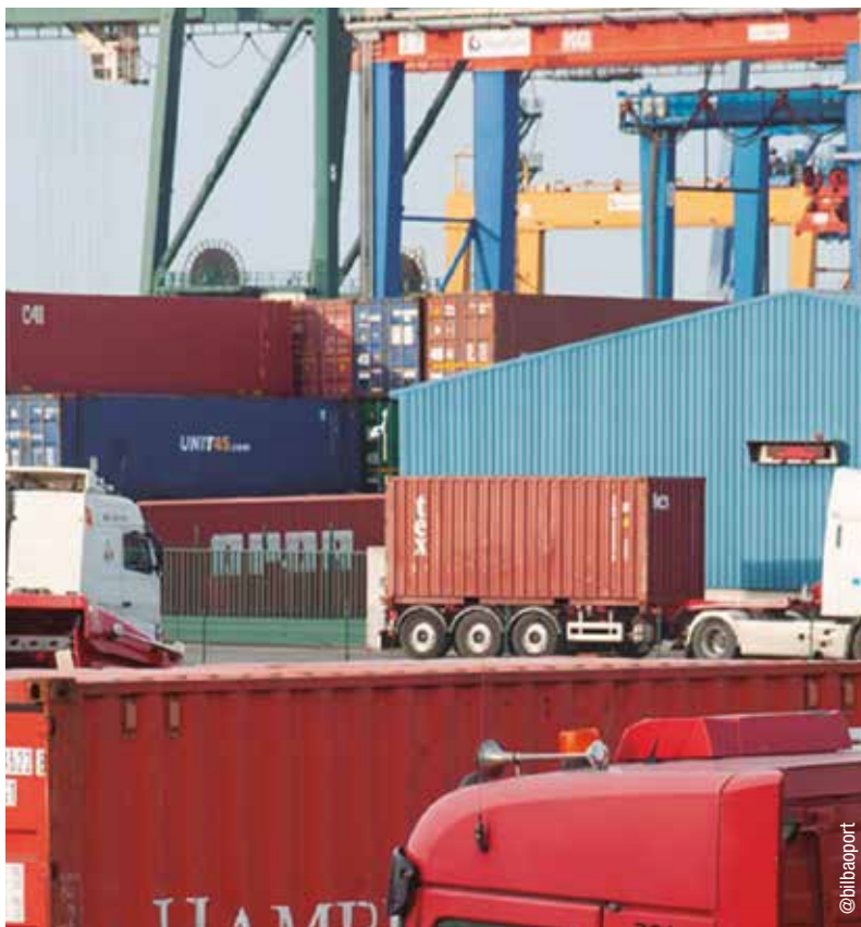
Puerto de Bilbao

Desde marzo se esperaba que el Gobierno aprobara una reducción de tasas portuarias ante el nulo tráfico de pasajeros y la caída en las mercancías