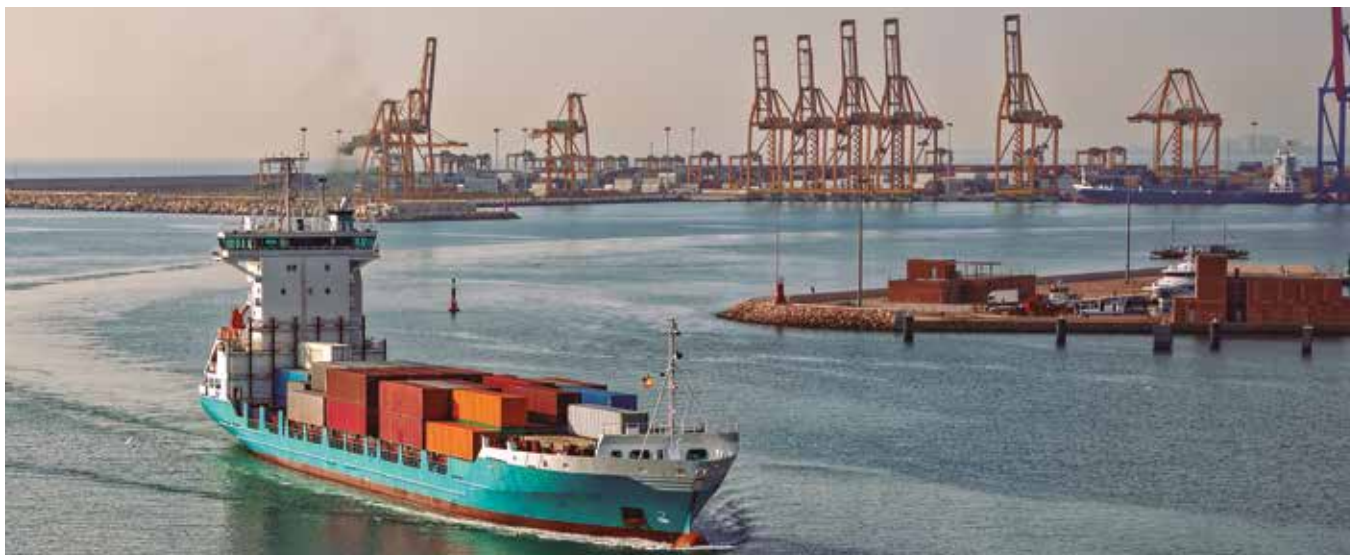
Buque de carga llega al puerto de Valencia

En total gestionó un 9,83 por ciento menos contenedores que en marzo de 2019, debido a la caída en una cuarta parte de los tráficos de contenedores vacíos. Pero las exportaciones crecieron un 2,86 por ciento, lo que se interpreta desde Valencia-port señalando que “las empresas que configuran el hinterland han decidido anticipar sus entregas a mercados internacionales a marzo”.