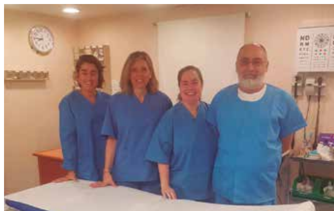
Equipo médico del buque Juan de la Cosa