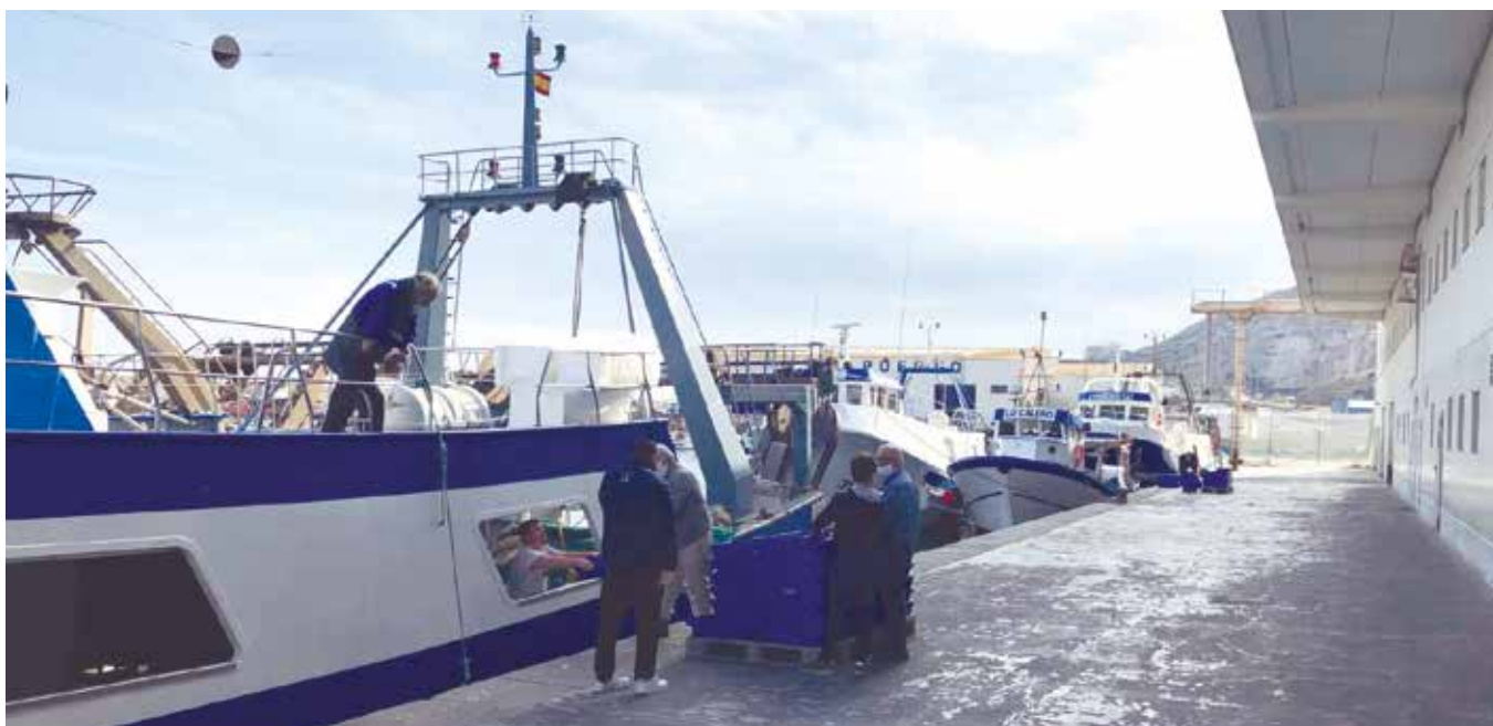
Muelle pesquero de Almería

E n plena pandemia de coronavirus, la alimentación se ha convertido en una de las industrias más necesarias para la población, y el sector primario, el pesquero en concreto, está respondiendo, pese a ser uno de los más afectados por la escasez de medidas de prevención y protección. Nuestra prioridad: garantizar que no exista en ningún momento riesgo de desabastecimiento de productos pesqueros en los hogares españoles y proporcionar seguridad a los tripulantes que han manifestado su voluntad de seguir faenando, así como a los distribuidores y demás profesionales de la comercialización que siguen operativos.