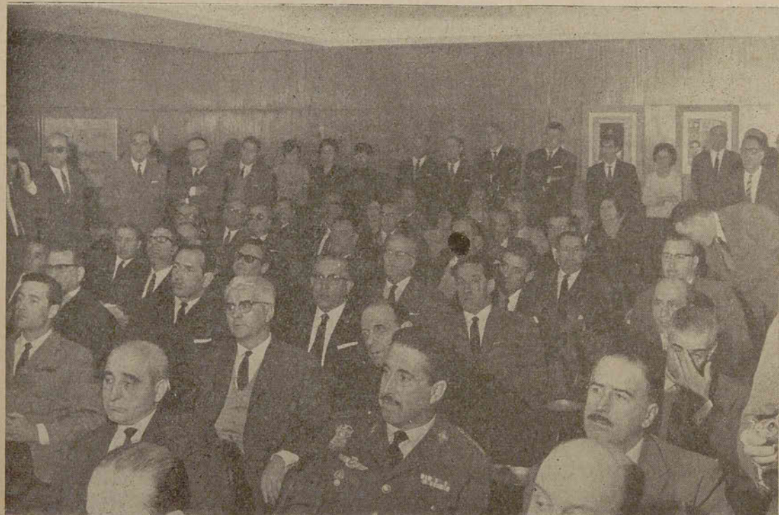
ANGULO SUPERIOR DERECHO: EL MINISTRO DE HACIENDA, DON JUAN JOSE ESPINOSA, DURANTE SU DISCURSO. SOBRE ESTAS LINEAS: ASPECTO PARCIAL DEL SALÓN DE ACTOS DEL CREDITO SOCIAL PESQUERO, DURANTE LA SESIÓN INAUGURAL.