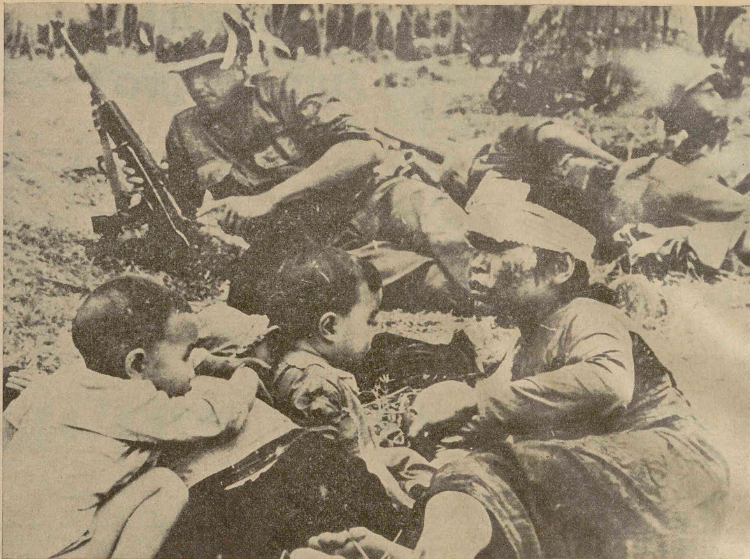
LEJOS LOS TIEMPOS EN QUE LA GUERRA ERA SOLO OFICIO DE GUERREROS. VEAN, SI NO, ESA IMAGEN DOLORIDA DE LA MUJER VIETNAMITA Y SUS DOS PEQUEÑOS HIJOS. AL AMPARO PROVISORIO DE UNOS SOLDADOS NORTEAMERICANOS QUE ESTAN A LO SUYO, LA POBRE MUJER ESTA COMO SORPRENDIDA POR EL TRALLAZO DE LA GUERRA.