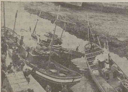
Cuando la marea está baja

La reunión de Deva no fue oficial. Como puede verse, respondió a los acuerdos adoptados por el sector industrial en reuniones de fechas anteriores.