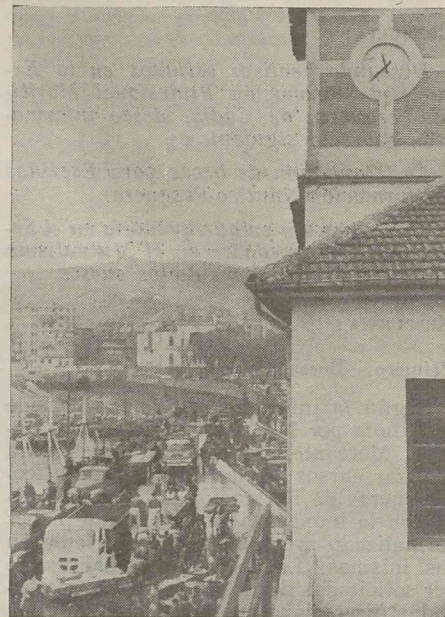
Mediodía: aún hay anchoas en el muelle

las cofradías de Vizcaya al instalar, en cooperativa, una fábrica dedicada a absorber los excedentes de pesca. Esta fábrica es muy espaciosa y allí encuentran trabajo durante la temporada unas 140 mujeres. Y no sólo eso. La fábrica está instalada en Santurce y los pescadores se han encontrado con la bonita novedad de ver sus precios defendidos en la subasta por la puja de la Cooperativa. La Cooperativa en fin, puja en competencia con los demás licitadores, compra y elabora la anchoa, la vende y obtiene unos beneficios que redundan en favor de sus asociados.