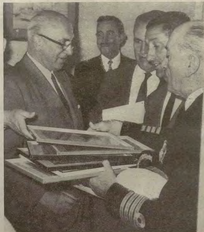
Varios momentos de las reuniones y entrevistas que celebró el almirante Fontán, presidente del Instituto Social de la Marina, durante su visita a los puertos de Portonovo (primera foto) y El Grove.

Por la tarde, el Presidente y demás autoridades visitaron los barcos de las cooperativas de producción pesquera en los que hicieron un recorrido por la ría para desembarcar en Vigo.