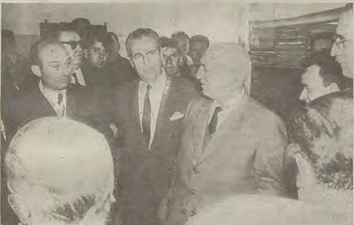
En las fotografías, tres momentos de la visita del presidente y el subdirector general del Instituto Social de la Marina, a los puertos de La Coruña.